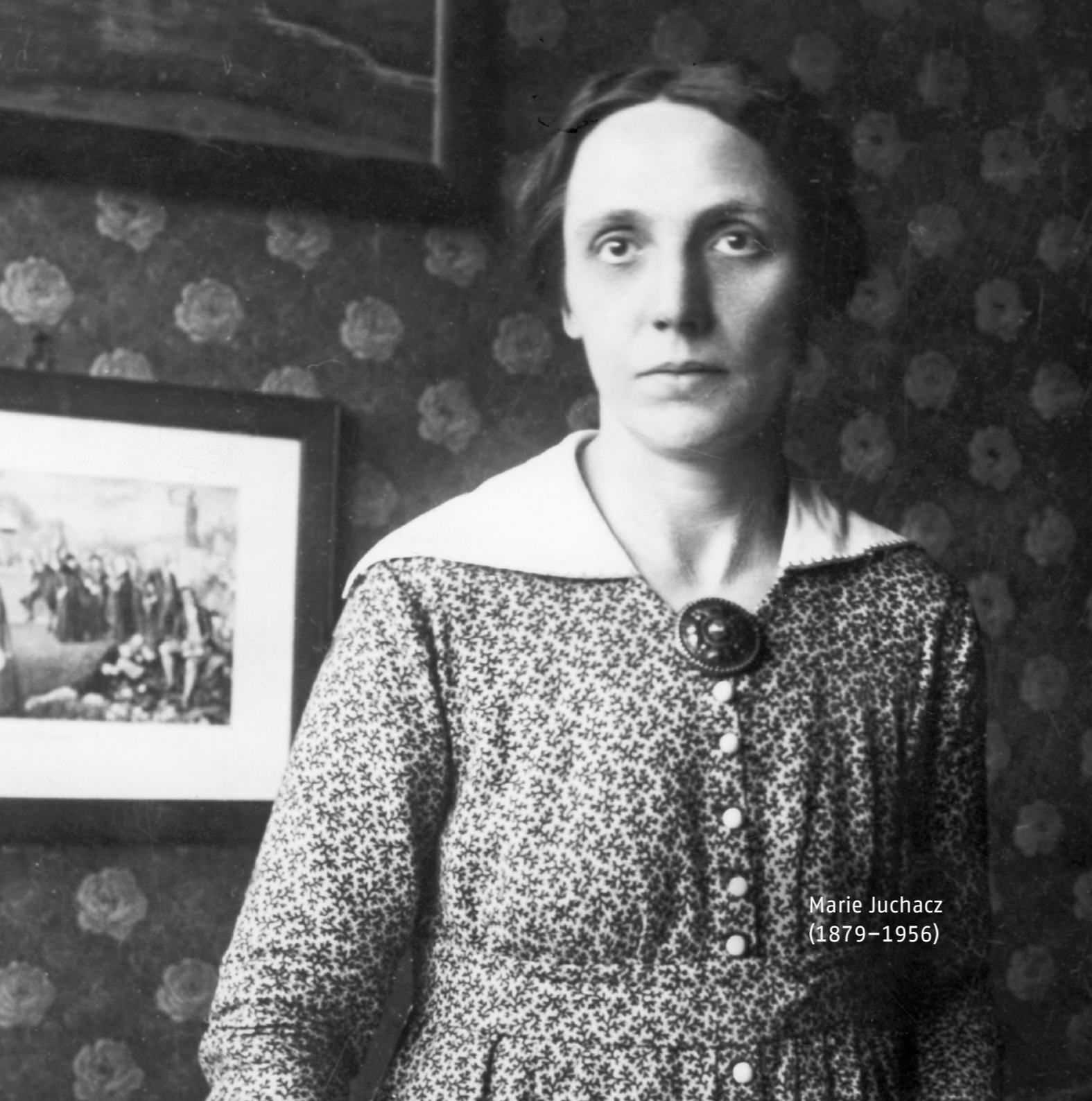
Marie Juchacz (1879–1956)